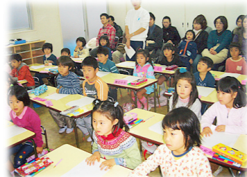
※緊急事態宣言前の写真です。現在はマスク着用・1クラスの人数制限・保護者参観はなしとしております。